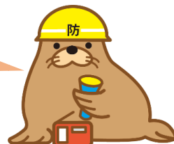
とどまるマンション促進課長 “トドまるくん”