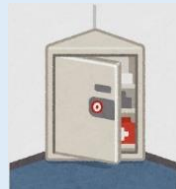
防災キャビネット