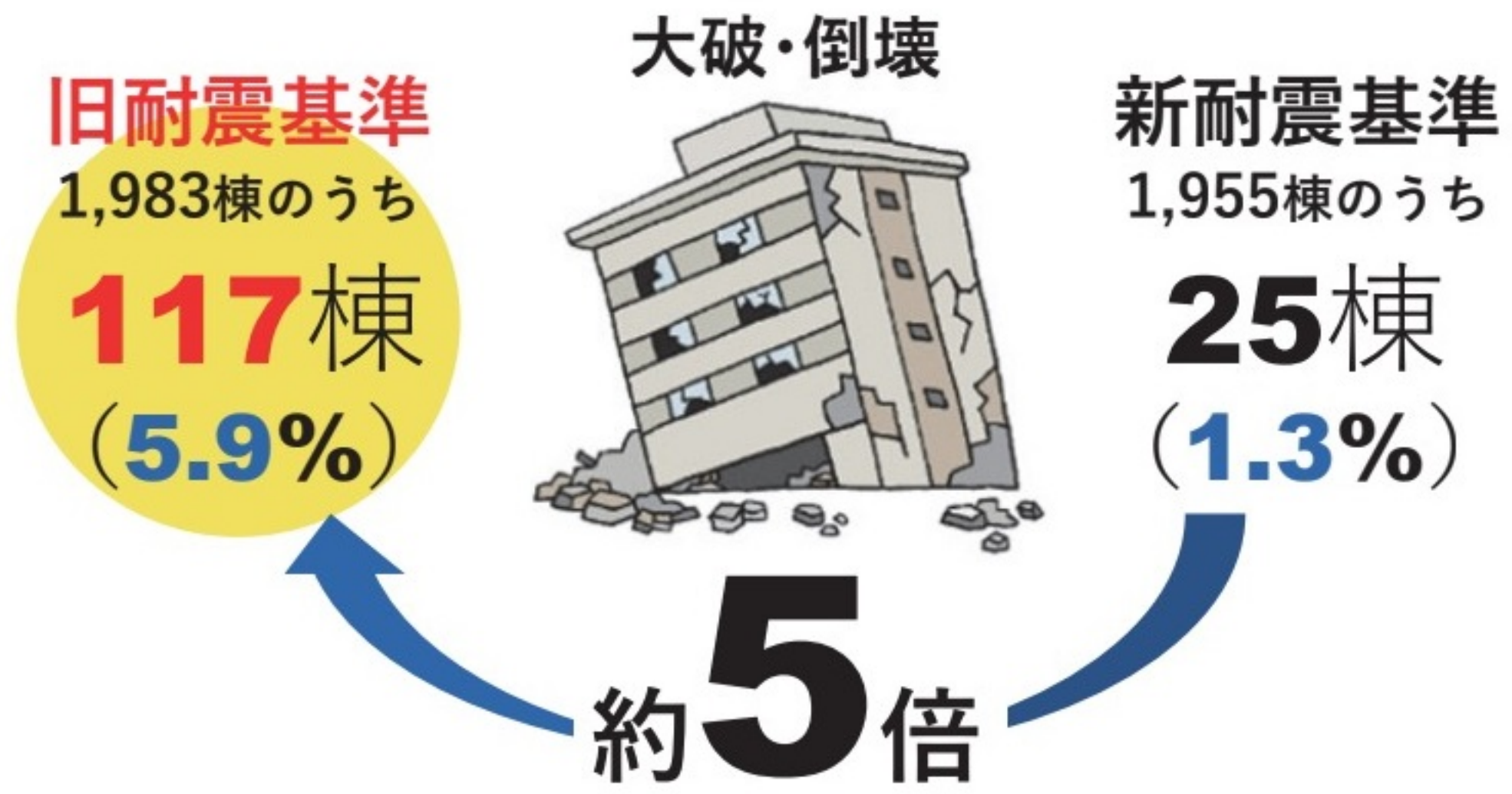
平成7年兵庫県南部地震被害調査最終報告書（建設省建築研究所）より

旧耐震基準の建物は大きな地震で被害を受けやすく、1995年の阪神・淡路大震災でも多くの被害が見られました。旧耐震のマンションは 耐震性不足の可能性 があるため、まずは「 耐震診断 」で現状の耐震性を知ることが重要です。